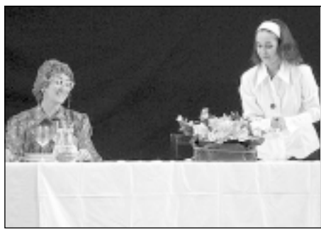
La empresa y el teatro se suben al escenario en el Matadero