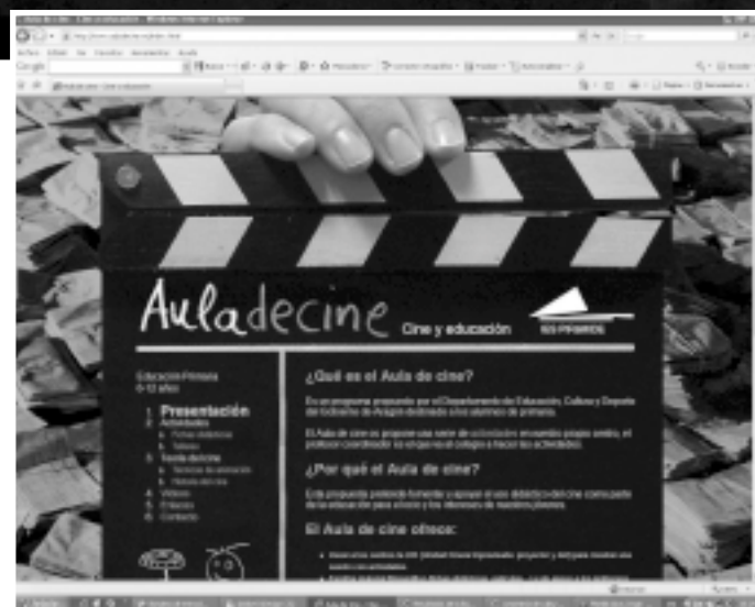
Página web de Aula de Cine.