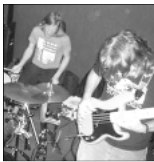
El trío de EEUU Ahleuchatistas actúa hoy en Huesca