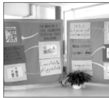
Actualidad de los colegios del Alto Aragón en el suplemento "Escolar"