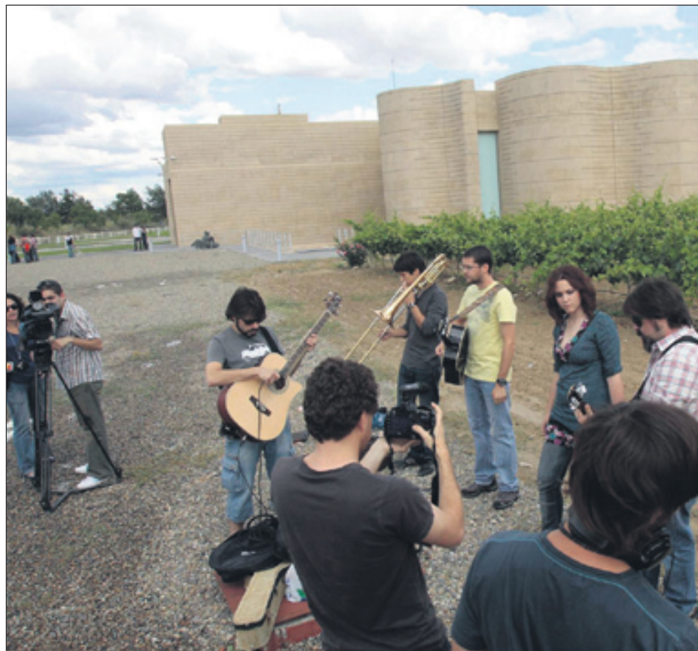
Los miembros de Lucca, ayer durante el rodaje de su videoclip. VÍCTOR IBÁÑEZ

"De hecho, ayer (por el miércoles), como llovía y vimos que podía seguir lloviendo, les dijimos que no se complicaran mucho, que no fueran a demasiados lugares y que se centrasen en una sola idea y una única localización". Sin embargo, como él mismo comprobó, el consejo no caló en sus alumnos, que minutos después de dar el pistoletazo de salida para comenzar a grabar, "se habían desperdigado tanto por el Centro de Arte y Naturaleza (CDAN, organizador del taller junto al Festival de Cine y el Instituto de Estudios Altoarago-