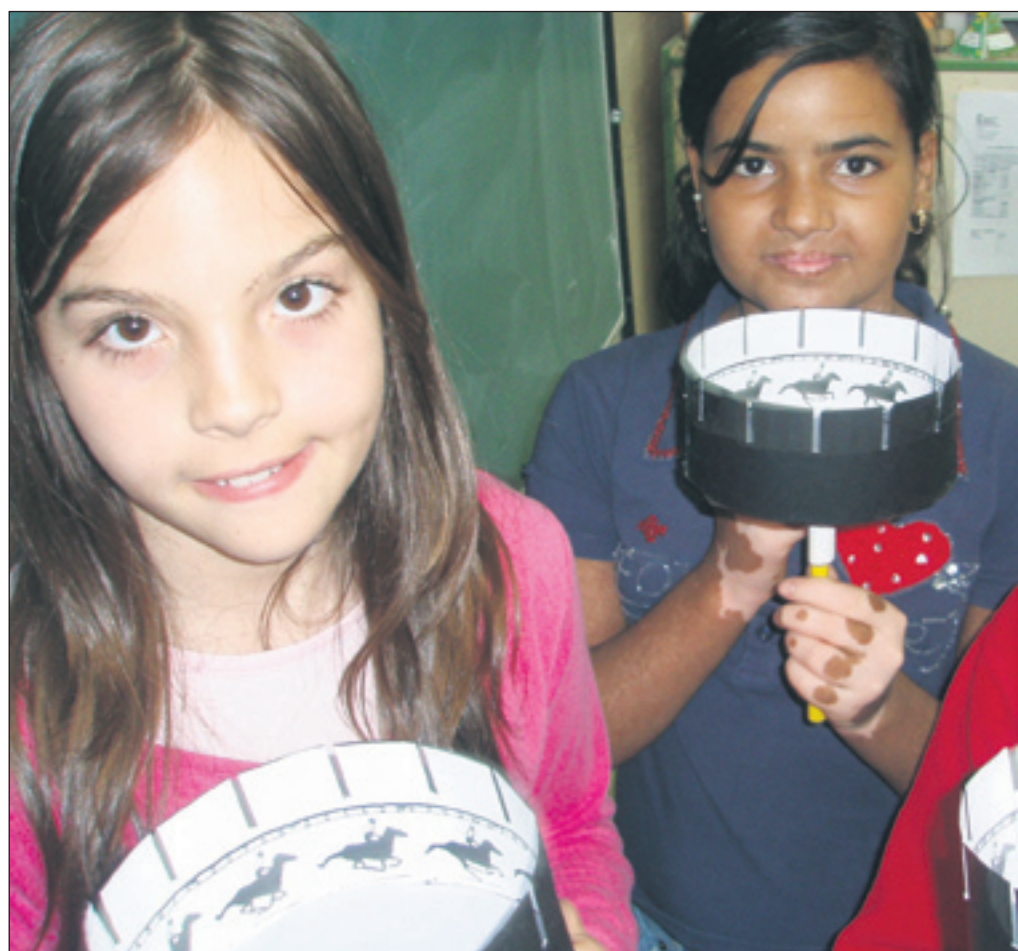
Tres escolares muestran zoótropos creados por ellos mismos. ALBERTO OLIVAR

Olivar explica la actividad, y los profesores ayudan a los chavales a construir el zoótropo. "Es un proceso que hay que seguir paso por paso, porque si no el zoótropo no gira y puede resul-