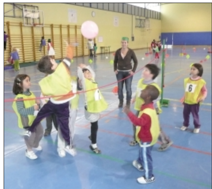
Practicando deporte. S.E.

Una jornada muy completa en la que todos y todas han dado lo mejor de sí mismos y por lo que han sido premiados con una corona de olivo, una medalla, un diploma y muchos aplausos de todos sus compañeros.