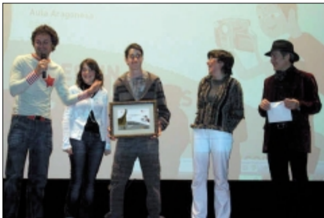
Entrega de premios. S.E.