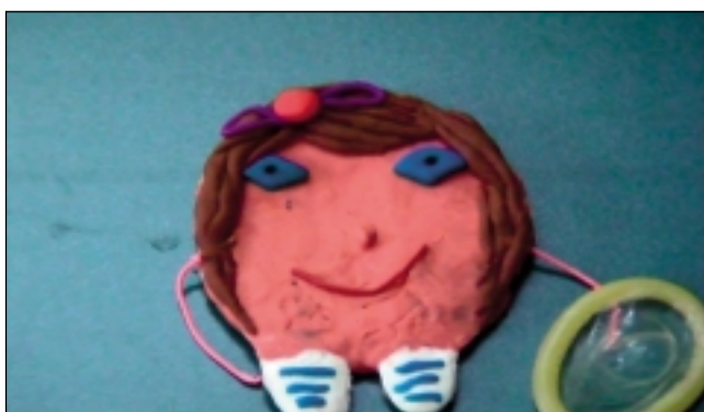
La película trata el riesgo de las relaciones sexuales sin protección. S.E.