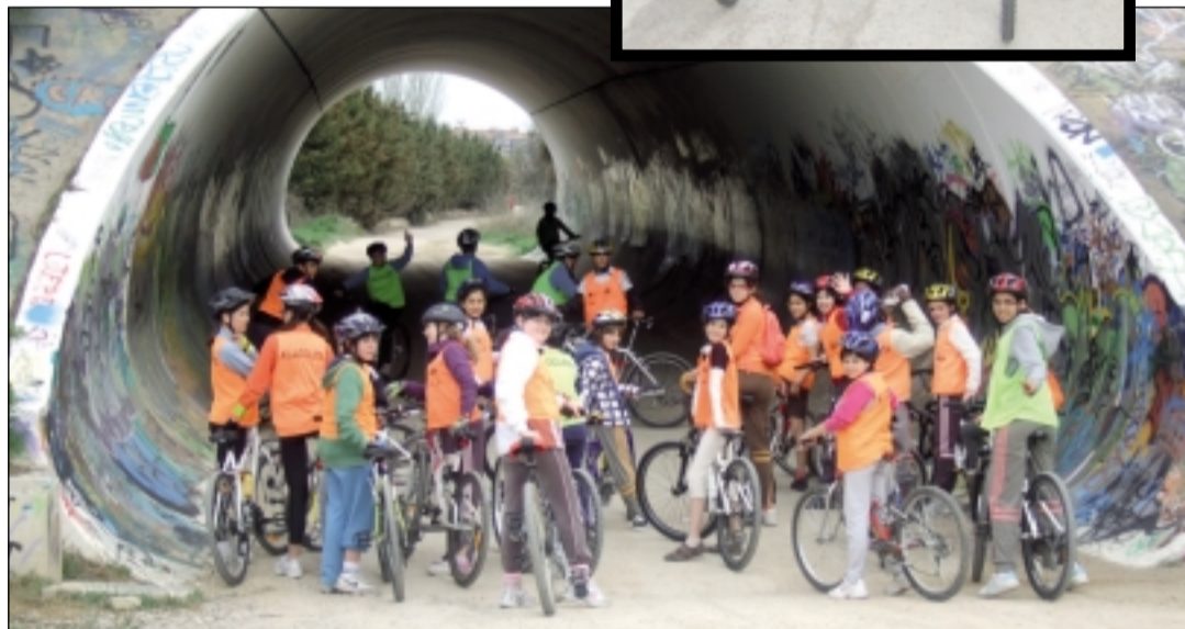
Recorrido por los alrededores de Huesca. S.E.