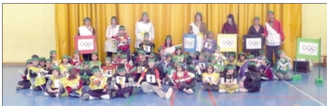
Alumnos participantes en las mini-olimpiadas. S.E.